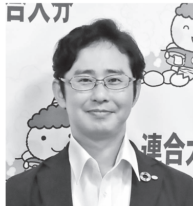
副事務局長（インタビュー時）

連合の基本的な考え方でもありますが、やはり平和であるからこそ安心して暮らし、働くことができますので、今後も続けていかねばならない活動のひとつだと思います。